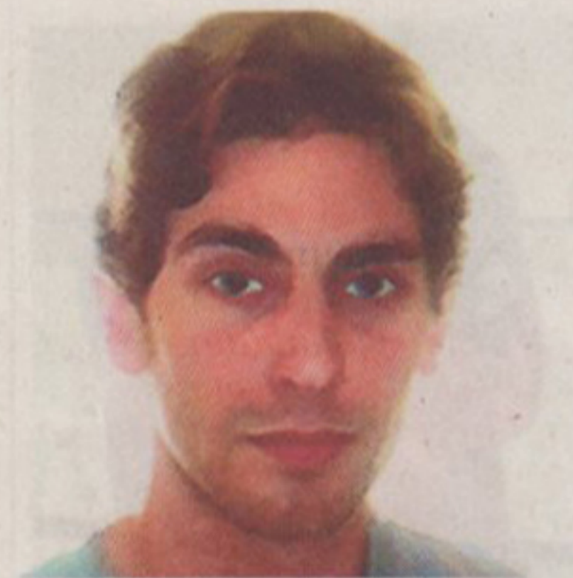
Assassiné il y a trois ans, déjà.